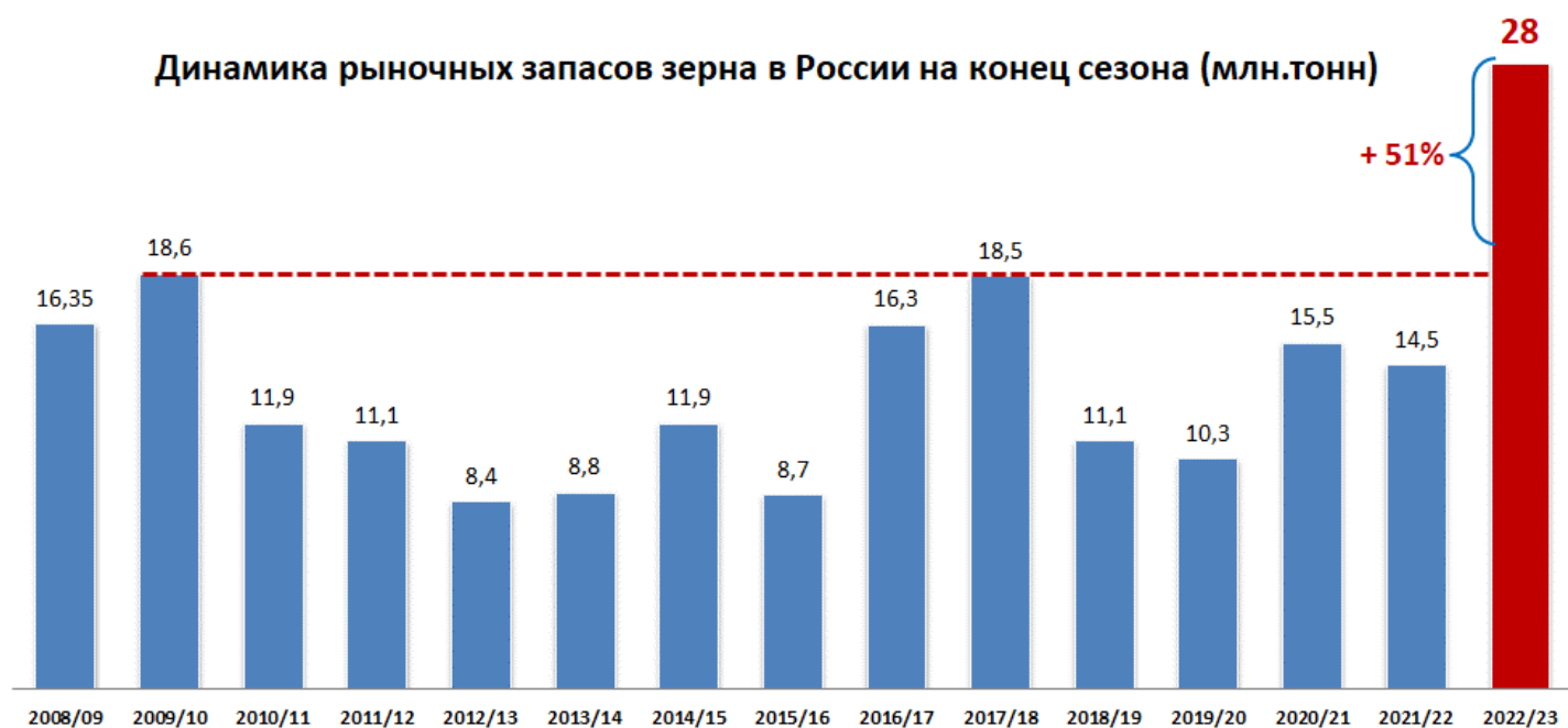
Динамика рыночных запасов зерна в России на конец сезона (млн.тонн)

Вырастить урожай—полдела, гораздо важнее обеспечить его рынком. Однако, у рынка зерна большие проблемы: экспортные пошлины, дешёвые экспортные валюты доллар и юань, мизерные закупочные интервенции в объёме 2% от урожая зерна. В какой валюте не экспортируй российское зерно—рублевая выручка оставляет желать лучшего. И все эти барьеры идут от государства. С рынком сделано всё, чего нельзя было делать при рекордном урожае.