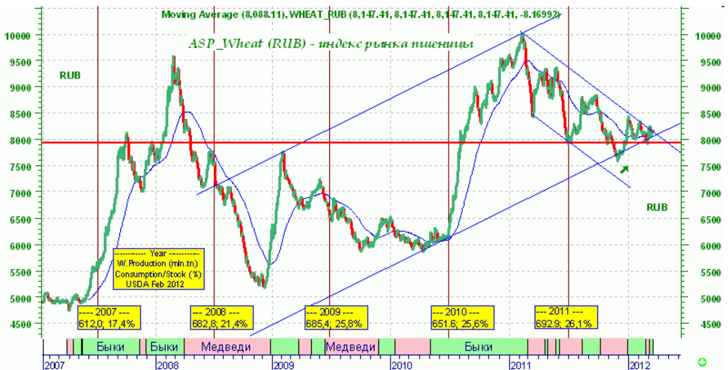
Средние мировые цены зернового и масличного рынка в российских рублях по индексам АГРОСПЕКТЕРА.